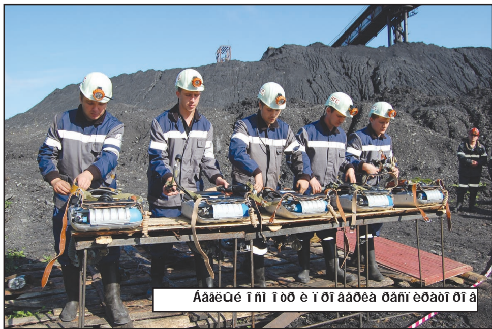
Члены ВГС – настоящие гвардейцы. Им не выдают краповых касок после всех испытаний. Но они – лидеры, пример для остальных горняков.

тель, наложили шины на сломанное бедро. Быстрее всех эти действия произвело отделение бойцов шахты «Первомайская». Как говорится, дома и стены помогают. Анжерцы действовали неспешно, но допустили минимальное количество ошибок. А вот спасатели шахты «Березовская» условно погибли, забыв включиться в респираторы в условно газированной атмосфере. Так определились лидер, крепкий середняк и аутсайдер конкурса.