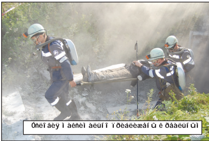
Оперативно ликвидировать возгорание, оказать первую помощь, вывести людей из опасной зоны могут бойцы вспомогательной горноспасательной службы.

А 20 августа на полигоне шахты «Первомайская» прошел профессиональный конкурс команд ВГС. В нем участвовали спасатели шахт «Первомайская», «Березовская» и шахтоуправления «Анжерское». Обстановка максимально приближена к реальной. Первый этап конкурса – разведка и оказание помощи пострадавшему. Бойцы провели предварительную проверку оборудования, включились в респираторы, произвели замер газов в атмосфере условной выработки и направились в «аварийный штрек» (специально оборудованная на полигоне дымная камера). Через некоторое время они вынесли оттуда пострадавшего (манекен), сделали ему искусственное дыхание, включили его в самоспаса-